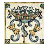
ORDINE dei "SERVI di MARIA"